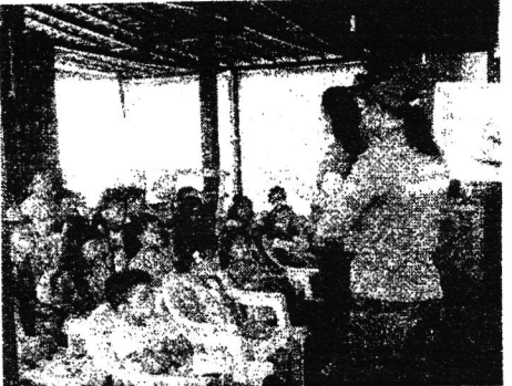
Crianças e adolescentes assistem a palestras no teatro de fantoche

A Prefeitura de Davinópolis através das secretarias municipais de Educação e Agricultura, oportuniza a participação de dezenas de estudantes do ensino fundamental no projeto "Fazenda Educação", promovido pela Agência Estadual de Defesa Agropecuária do Maranhão (AGEAD).