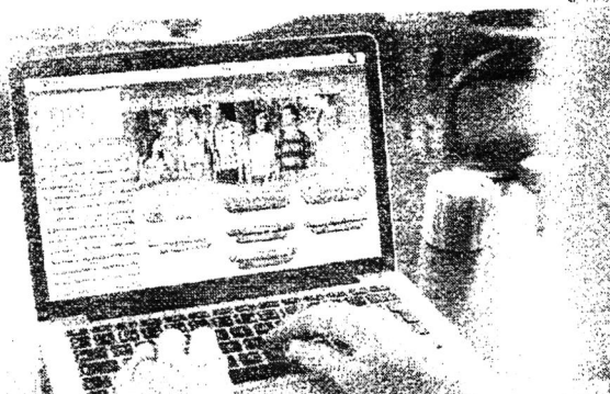
Inscrições para concorrer a uma das vagas da edição 2018 no Fies devem ser feitas no site oficial do programa

O Ministério da Educação (MEC) anunciou que a segunda edição do Fies (Financiamento Estudante) para o ano de 2018 será iniciada no dia 16 de julho. Segundo o MEC, para concorrer a um financiamento, o candidato precisa ter feito uma das edições do Exame Nacional do Ensino Médio (ENEM) a partir de 2010. As inscrições para a segunda edição do Fies 2018 serão feitas no site oficial do programa, www.fies.gov.br , a partir das 14h de cada dia, de segunda a sexta-feira, entre os dias 16 e 23 de julho. O prazo para inscrição encerra-se às 23h59 de cada dia. Para participar do Fies, o candidato precisa ter concluído o ensino médio em uma instituição de ensino credenciada pelo MEC e ter participado de uma das edições do ENEM a partir de 2010. O candidato também precisa ter concluído o curso de graduação em uma instituição de ensino credenciada pelo MEC e ter concluído o curso de graduação em uma instituição de ensino credenciada pelo MEC.