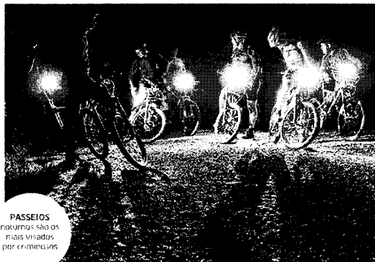
PASSEIOS noturnos são os mais visados por criminosos