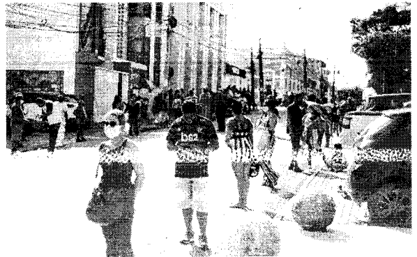
Muita exposição ultravioleta pode causar manchas na pele, provocar, também, desidratação e câimbra de calor

A exposição prolongada ao sol e ao calor, especialmente em filas, pode ser prejudicial à saúde, causando desidratação e outros problemas. É importante tomar medidas para se proteger, como usar protetor solar e beber água regularmente.