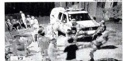
Imagens da abordagem truculenta, na cidade de Rosário, viralizaram