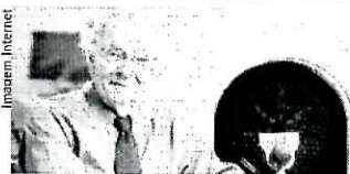
Alberto Dines deixa lacuna no jornalismo brasileiro

Alberto Dines era um apaixonado pelo jornalismo, estudando e mostrando suas perspectivas, chegando, inclusive, a ga-