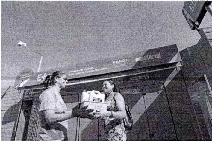
Antepeça sua ida ao E+ Reciclagem e garanta bônus na fatura de energia

O Dia Mundial da Educação Ambiental, celebrado em 26 de janeiro, é uma data significativa que visa promover a conscientização sobre a importância da educação ambiental em todo o mundo. A Equatorial Maranhão apoia a causa por meio do programa E+ Reciclagem, iniciativa que promove sustentabilidade através da reciclagem de resíduos. Só no ano de 2025, a Distribuidora recolheu 3,63 mil toneladas de materiais recicláveis, reduzindo a geração de 13 mil toneladas de lixo no meio ambiente, o que equivale a um ano de retornar mais de R$118 mil em descontos na conta de energia de clientes que participaram da ação. Além disso, com a ação, 38 mil árvores foram preservadas.