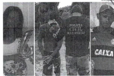
Barico foi preso pela polícia, acusado de matar Ducinalva com uma facada